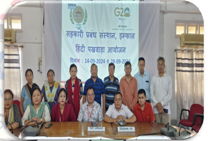
सहकारी प्रबंध संस्थान, इम्फाल