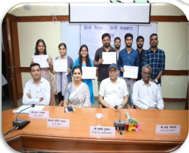
क्षेत्रीय सहकारी प्रबंध संस्थान, गांधीनगर