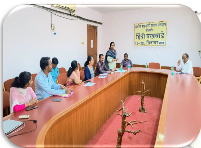
क्षेत्रीय सहकारी प्रबंध संस्थान, बंगलूर

एनसीसीटी के विभिन्न प्रबंध संस्थानों द्वारा 14-28 सितंबर, 2024 तक हिंदी पखवाड़े का आयोजन किया गया। इस दौरान संस्थानों द्वारा हिंदी टिप्पण-आलेखन, हिंदी टंकण, हिंदी आशुभाषण, निबंध लेखन, कविता पाठ, हिंदी गीत, सुलेख एवं अनुवाद आदि प्रतियोगिताओं का आयोजन किया गया। विभिन्न प्रतियोगिताओं के विजेताओं को नकद पुरस्कार एवं प्रमाण पत्र प्रदान किए गए।