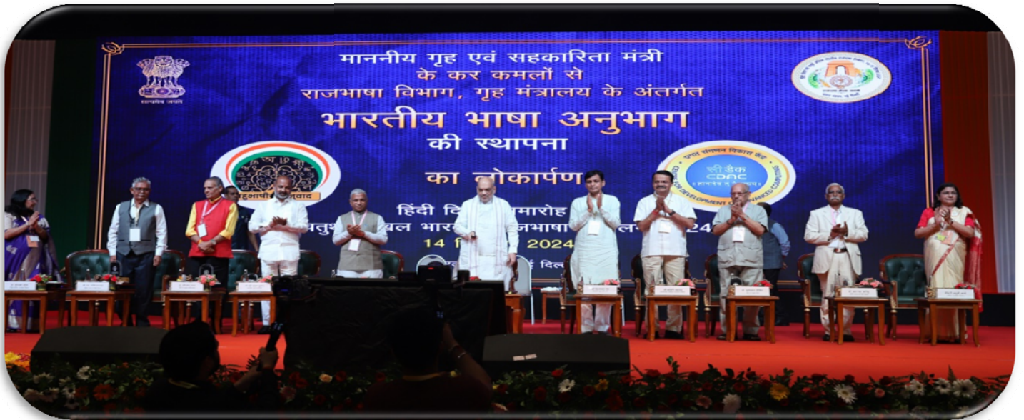
भारत मंडपम में दिनांक 14.09.2024 को आयोजित हिंदी दिवस के उद्घाटन समारोह की एक झलक