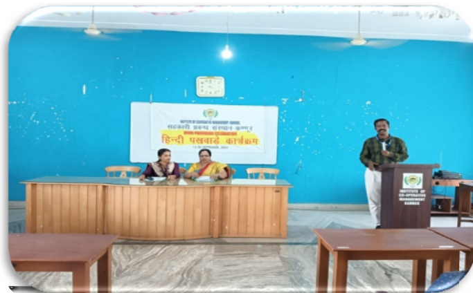
सहकारी प्रबंध संस्थान, कन्नूर