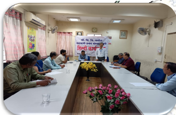
सहकारी प्रबंध संस्थान, पुणे