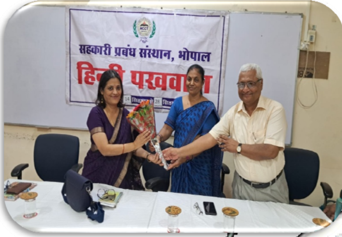
सहकारी प्रबंध संस्थान, भोपाल