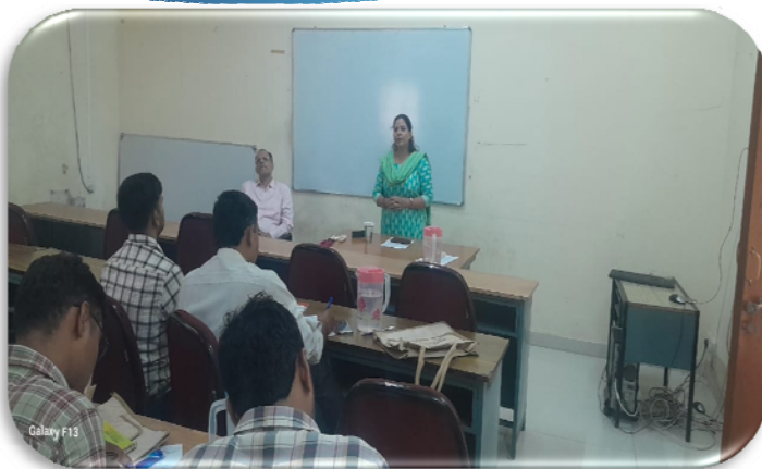
सहकारी प्रबंध संस्थान, जयपुर