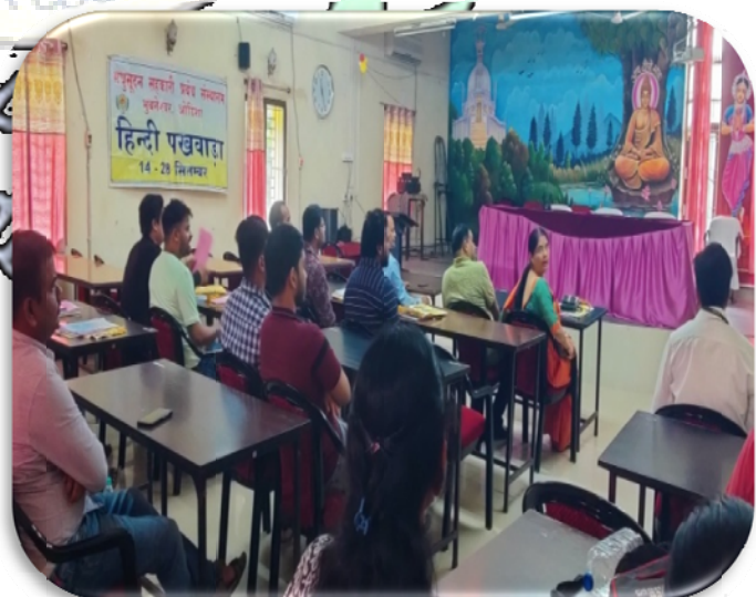
सहकारी प्रबंध संस्थान, भुवनेश्वर