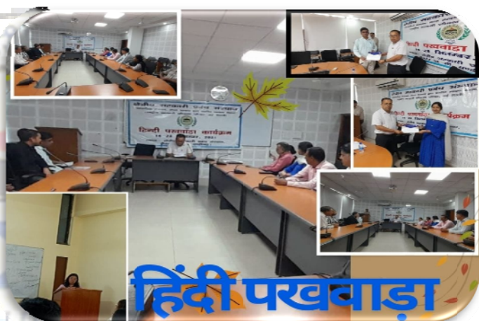
क्षेत्रीय सहकारी प्रबंध संस्थान, चंडीगढ़