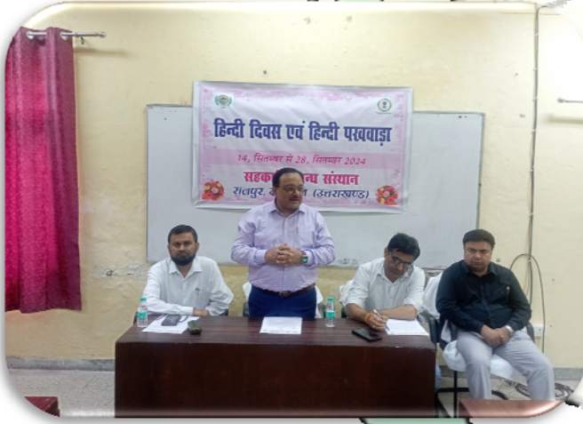
सहकारी प्रबंध संस्थान, देहरादून