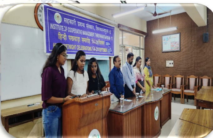
सहकारी प्रबंध संस्थान, तिरुवन्तपुरम