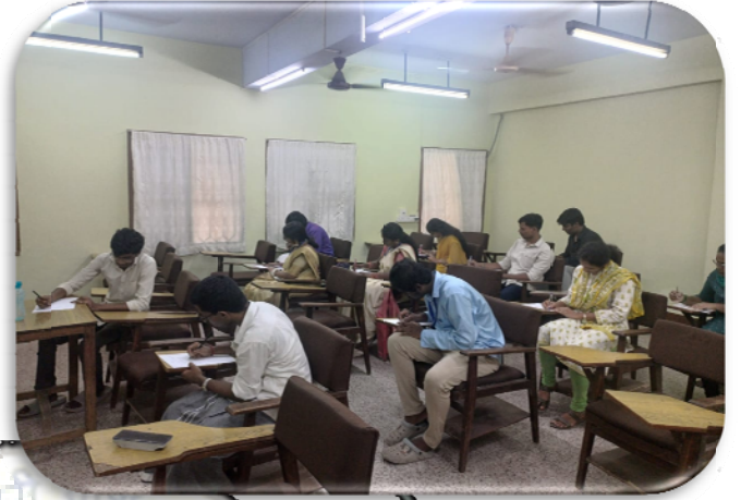
सहकारी प्रबंध संस्थान, चेन्नई